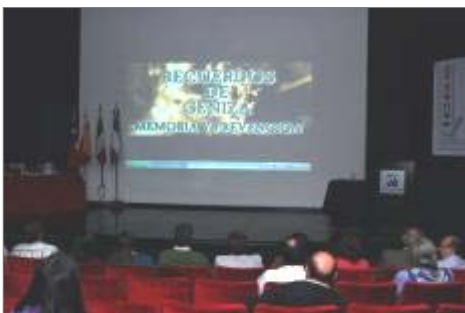
de Riesgo Ambiental y Territorial y de Ambiental del ICES Argentina.