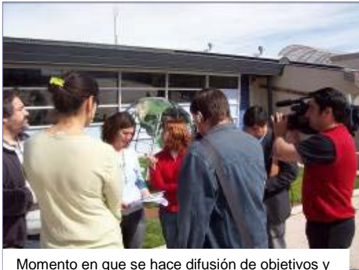
Momento en que se hace difusión de objetivos y contenidos de spot en medios de comunicación local.

Escuchar spot de prevención (1) (2) (3) (4) (5) Fundamentos spot radial ( archivo en pdf)