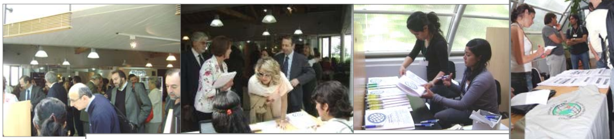
Inscripción de participantes en el E-ICES 4 Alumnos de la Tecnicatura en Conservación de la Naturaleza Sede Malargüe, del IEF César Coll (foto sup. derecha) colaboraron con acreditaciones.